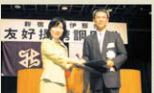
高遠町・伊那市・長谷村が3月に合併して誕生した新「伊那市」と、7月に友好提携を改めて宣言