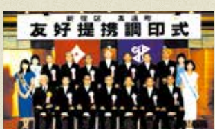
7月に新宿区・高遠町が友好提携を宣言