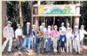
5月に区立小学校の子どもたちが伊那市で稲作や森林体験をする移動教室を開始