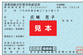
資格確認書 水色で有効期限は 令和9年7月31日