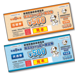
商店街ハッピー商品券と「はぴれん」