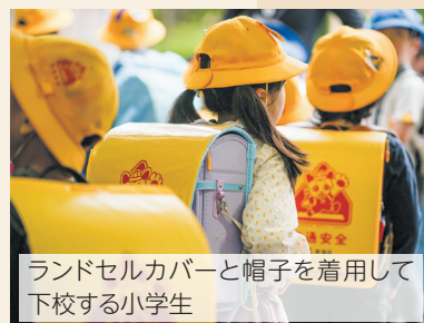
ランドセルカバーと帽子を着用して下校する小学生

3月20日にはMUFGスタジアム(国立競技場)で寄贈式を行い、約60人の新1年生が参加してくれました。子どもたちの安全を、新宿のまちのみんなで見守っていきましょう!