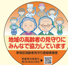
高齢者見守り登録事業者ステッカー