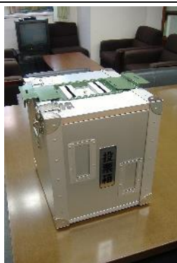
投票箱 (2,000 票用)