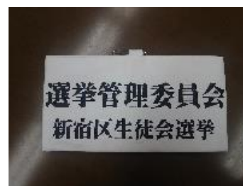
選挙管理委員会腕章