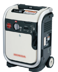
カセットボンベ式 発電機 (防災資機材例)