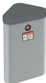
エレベーター用 防災キャビネット

備蓄食料・給水資機材・トイレ資機材等の防災備蓄品の購入費用を合計10万円(税込み)を限度に助成します。