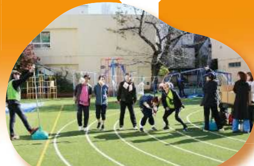
コミュニティスポーツ大会