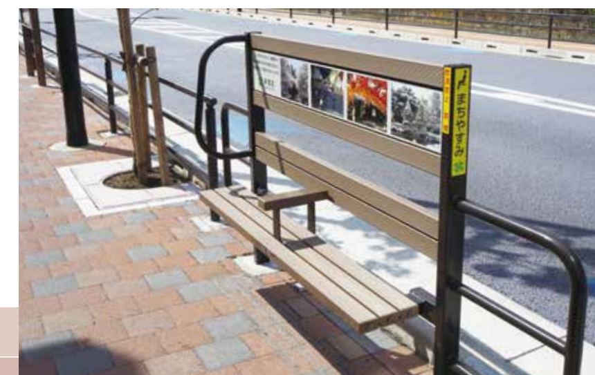
まちやすみベンチの設置