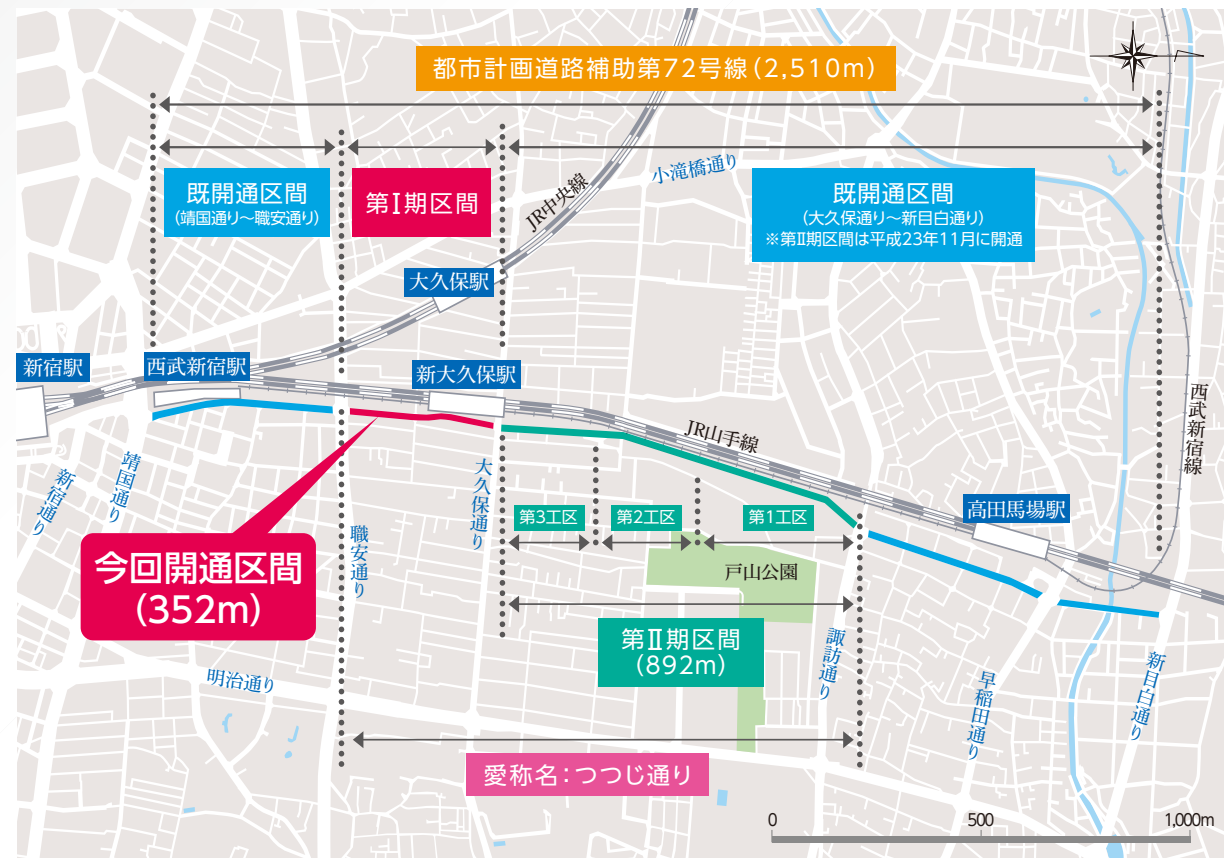
補助72号線全線案内図