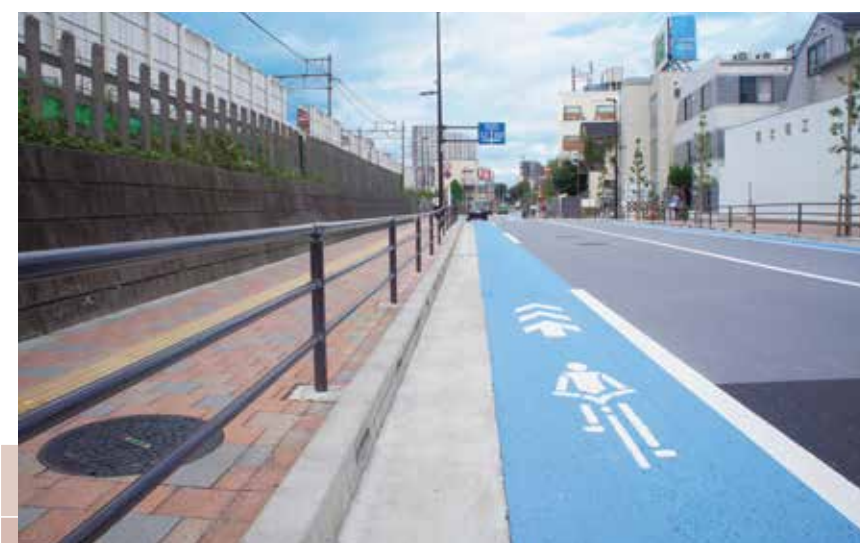
自転車専用通行帯設置