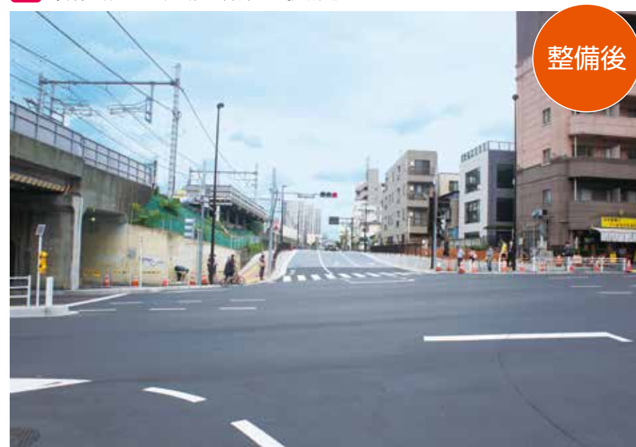
西武新宿駅付近から新大久保駅方面を望む