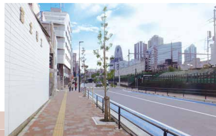
道路のバリアフリー化