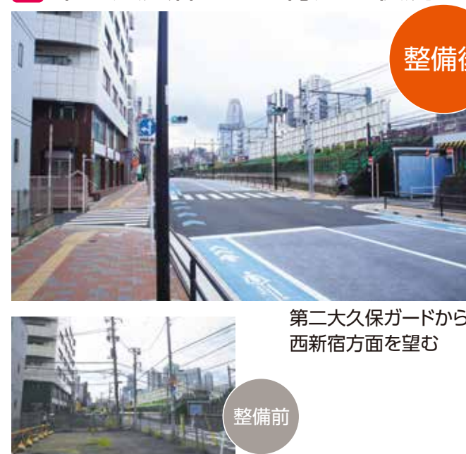
第二大久保ガードから西新宿方面を望む