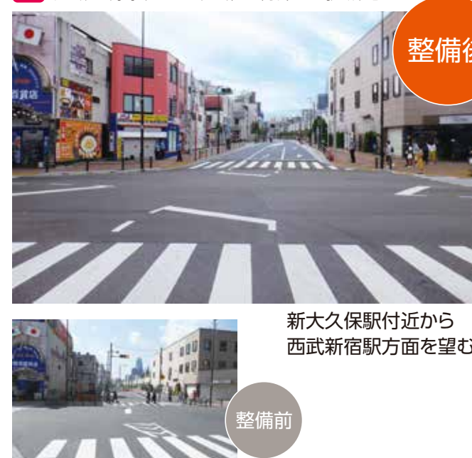
新大久保駅付近から西武新宿駅方面を望む