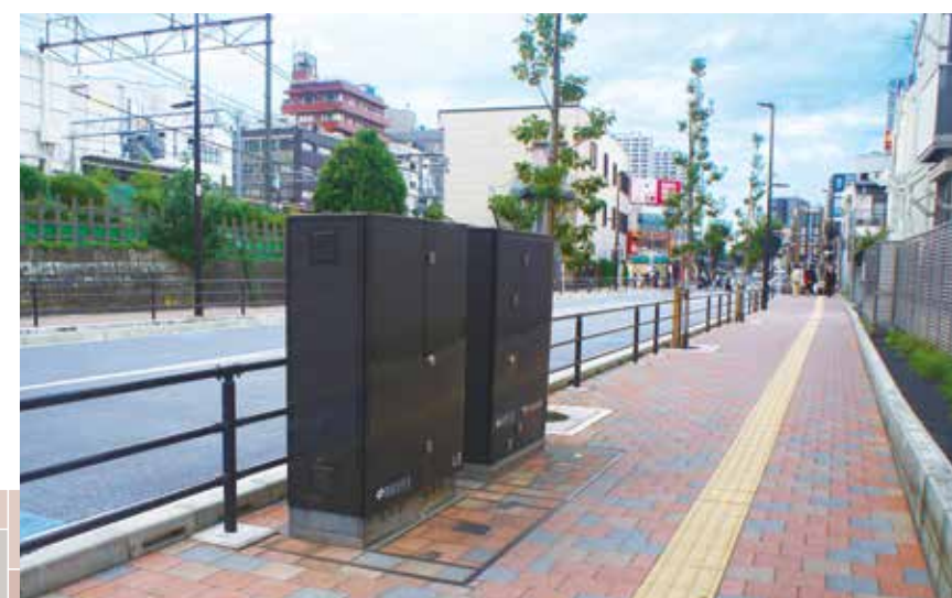
電線共同溝による電線類の地中化