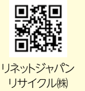
リネットジャパンリサイクル(株)