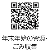
年末年始の資源・ごみ収集