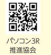
パソコン3R推進協会