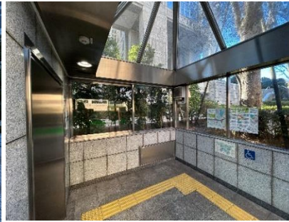
都庁前駅 A 4 出入口 (案内を掲示)