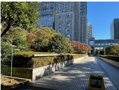
緑の橋（新宿中央公園側）