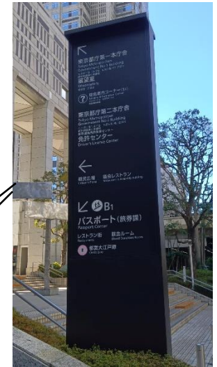
議事堂前サインージ (案内を掲示)