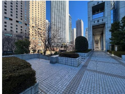
一庁北側外階段前