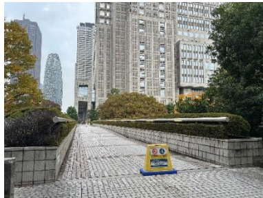
虹の橋（新宿中央公園側）