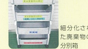
細分化された廃棄物の分別箱

独自の減量計画を作り、細かい分別ルールを定め、すべてのテナントに啓発し、減量の意識を高める取り組みを行っている。ビル内の各テナントにも事務用品類別に表示された分別用の小箱を渡し、一次分別を徹底している。特に紙類については三段ボックスを各事業所に設置し、再利用物を細かく分けていた。