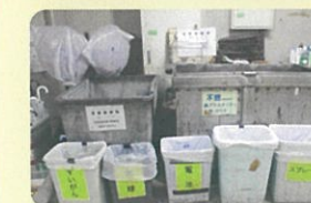
誰にとっても分かりやすい分別表示

建築物の大部分を占めるホテル部分も含めた事業ごみの把握について、管理者（廃棄物管理責任者）が統括して行っており、建築物全体としてごみの適正処理及び減量を推進している。