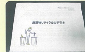
オリジナルのリサイクルの手引き