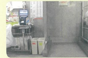
ごみ計量器とシール印刷機

オリジナルのリサイクルの手引きを作成し、入居テナントに対し配布し、啓発、分別の徹底を実践している。