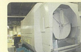
圧縮機によるごみ排出量の削減