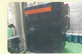
ステンチールポストによる排出の工夫