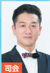
司会 キクチウソツカナイ。