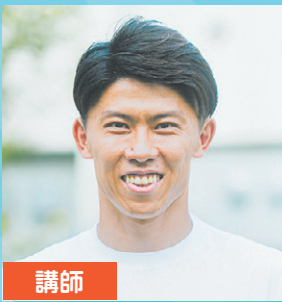
講師 太田宏介(元サッカー日本代表)