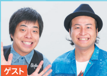
ゲスト バンビーノ