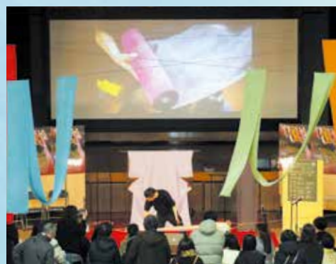
染色デモンストレーション&トークショー