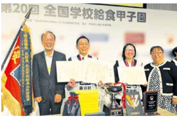
決勝大会表彰式の様子