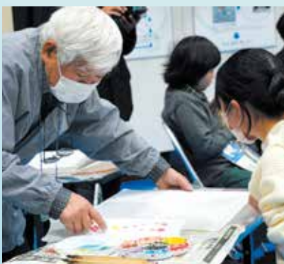
染色ワークショップ