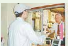
仕事のイメージ 小学校での施設管理