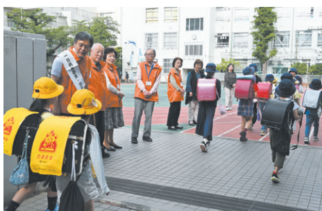
区長の一曰民生委員・児童委員の活動の様子

商品等を追加し、選定しました。認定期間は5年間で、今後、インターネットやカタログ通販、常設販売など多様なプロモーションを展開していきます。区外へ出かける際の土産としてもぴったりな品々が揃っていますので、新宿の魅力を伝えるきっかけにぜひご利用ください。来年度には外食・テイクアウト部門の認定も予定しています。リニューアルした「新宿逸品」により、新宿のさらなる魅力を発信していきます。