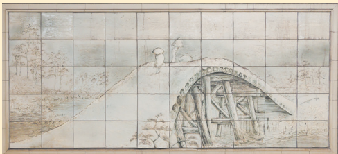
早稲田大学方面改札口通路にある江戸工芸「面影橋」

1日あたりの平均乗降人数は7万9,978人。駅周辺に早稲田大学のキャンパスが点在し、早稲田中学校や高等学校もあることから利用者は学生が中心です。特徴的なのが学校行事に連動して利用客の増減が大きいこと。学園祭やオープンキャンパス等が行われる日はいつも以上に駅も賑わい、夏休み・冬休みになると落ち着くのは学生街にある駅ならではのといえるでしょう。