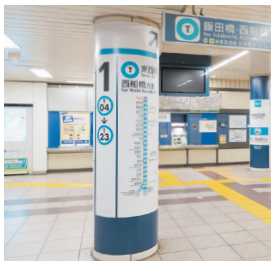
早稲田大学方面の改札口周辺