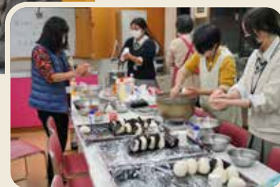
▶イベントの裏では、ボランティアスタッフたちが子どもたちのためににおにぎりを作るのに大忙し。