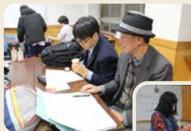
◀週1回の居場所づくり活動では、元教員たちがボランティアで学習指導をしている。

卒業生の中には、栄養士や建築士になって日本社会で活躍している人もいます。そのような先輩の頼もしい姿は、子どもたちの将来への励みになるのではないのでしょうか。