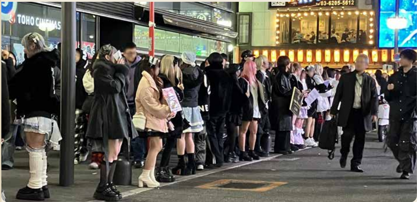
▲ TOHOシネマ近辺に集まる若い女性たち。毎週金・土曜日の夜にパトロールをし、団体のチラシを配る活動を続けている。

〒169-0051 新宿区西早稲田3-8-11 TEL 080(4676)0428 URL https://www.10dai20dai-ninshin.com/