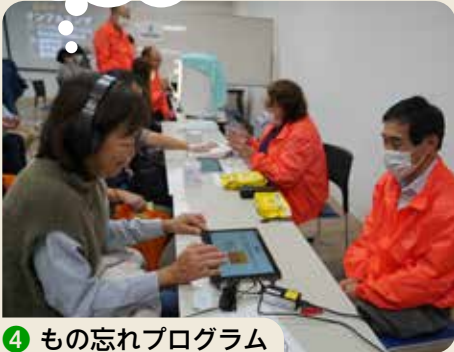
④ もの忘れプログラム