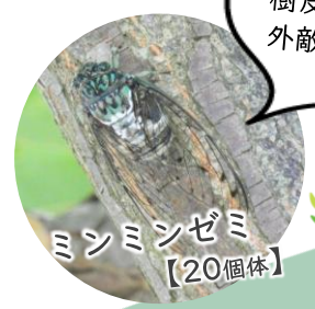
ミンミンゼミ 【20個体】