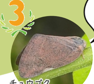
チュウゴクアミガサハゴロモ 【20個体】