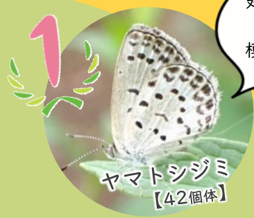
ヤマトシジミ 【42個体】