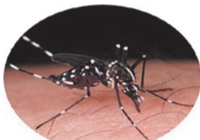
ヒトスジシマカ

ヒトスジシマカは、デング熱・ジカウイルス感染症などを媒介します。ヒトスジシマカの幼虫は、植木鉢の受け皿、雨ざらしのバケツやじょうろ、空き缶等にできる小さな水たまりに発生します。週に一度は、屋外の容器等に雨水がたまっていないかチェックしましょう。