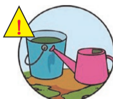
雨ざらしのバケツ・じょうろ