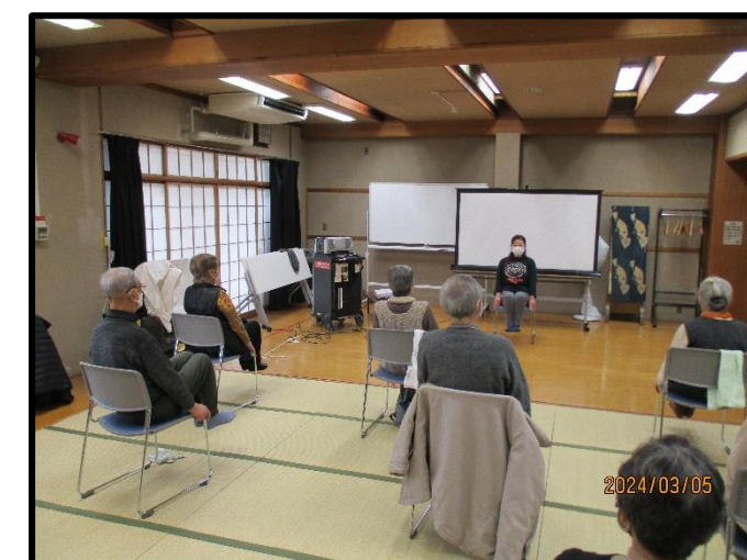
のびのびストレッチ