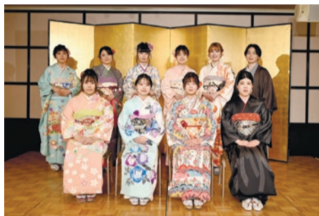
貸し出した晴着と晴着を着た参加者 (令和6年はたちのつどい)