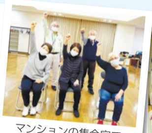
マンションの集会室で