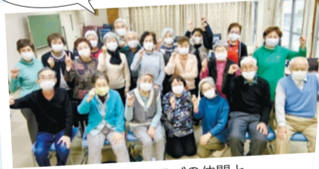
高齢者クラブの仲間と