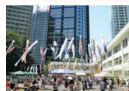
同イベントの様子

こどもの日に、こども向けの体験プログラムなどを用意した「芸術体験ひろば」を開催します。黒板アートや三味線体験などのプログラムを開催します。一部のプログラムへの参加には、事前の申し込みや当日整理券が必要です。申し込み方法等詳しくは、問合せ先ホームページ(右二次元コード) https://www.geidankyo.or.jp/12kaden/experience/detail/8251 でご案内しています。