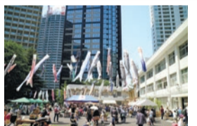
同イベントの様子

こどもの日に、こども向けの体験プログラムなどを用意した「芸術体験ひろば」を開催します。黒板アートや三味線体験などのプログラムを開催します。一部のプログラムへの参加には、事前の申し込みや当日整理券が必要です。申し込み方法等詳しくは、問合せ先ホームページ(右二次元コード) https://www.geidankyo.or.jp/12kaden/experience/detail/8251 でご案内しています。