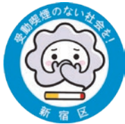
受動喫煙対策推進 Mascot「けむいモン」