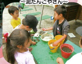
③ 園庭 ～泥だんごやさん～

【園長先生から一言】幼稚園は子どもたちにとって初めての社会です。いろいろな友達や大人に出会いそれぞれを認め合い、一緒に過ごすことの楽しさやすばらしさを感じて欲しいと思います。