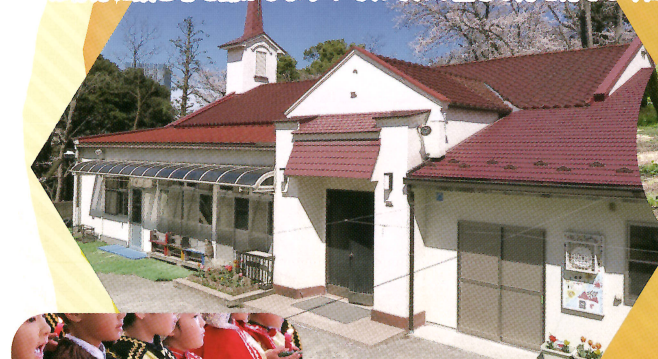
③ 園の目の前に広がる緑

① 大切にしているのは子どもたちのやりたいことが叶う園であることです。遊びを通して「気づき・困り・考える」場面にたくさん出会い、戸山の子たちは存分に頭と心を動かします！それぞれの生きる力を育む3年間です。