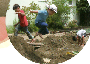
② 毎日のあそび じっくり集中して遊ぶ