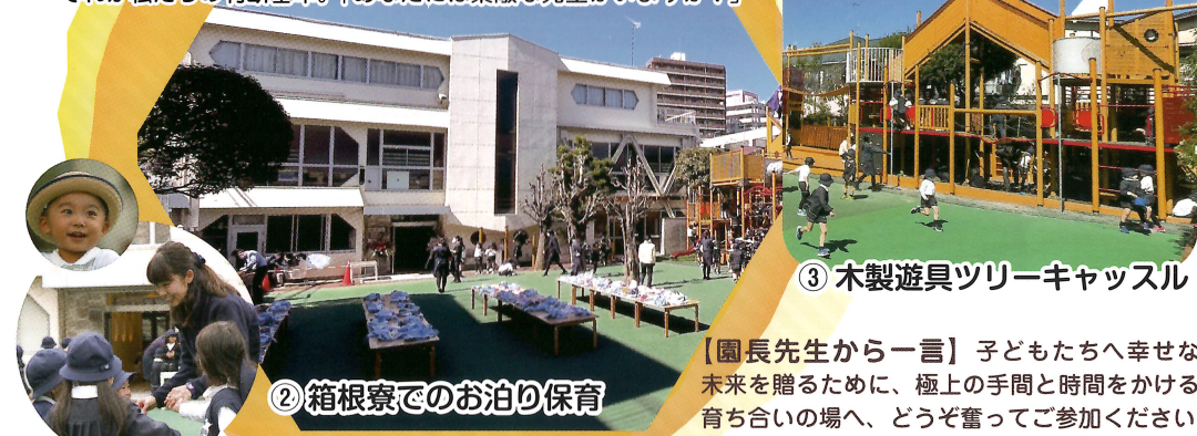
② 箱根寮でのお泊り保育

① 子どもが夢を描き、世界を彩って理想の明日へ向かう。そんな東京で最も不便で幸せな幼稚園が新宿にあります。子どものためになるかどうか、それが私たちの判断基準。「あなたには素敵な先生がいますか？」