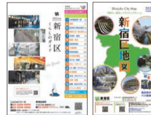
新宿区くらしのガイド 新宿区地図

区の施設や手続き、サービスなど、区民の皆さんに役立つ生活情報を掲載しています。特集記事「いざというときに備えて」「エリアシティウォーク」も、ぜひお役立てください。