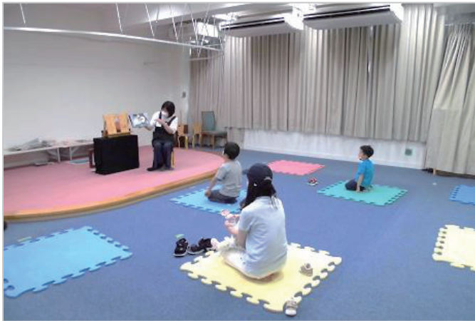
「おはなし会」の様子（こども図書館）