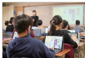
タブレット端末を使った授業の様子