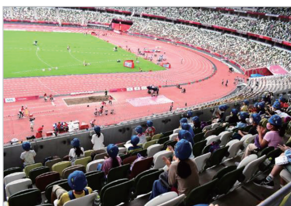
東京2020パラリンピック学校連携観戦