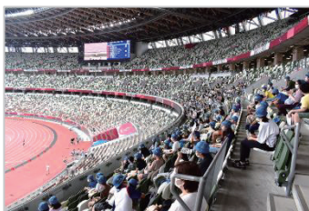
東京2020パラリンピック競技観戦