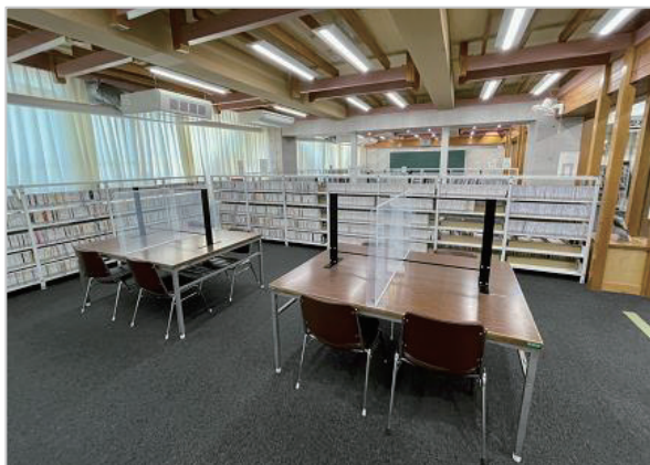
パーテーションで区切った閲覧席