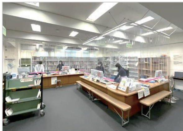
ビニールシートを設置したカウンター