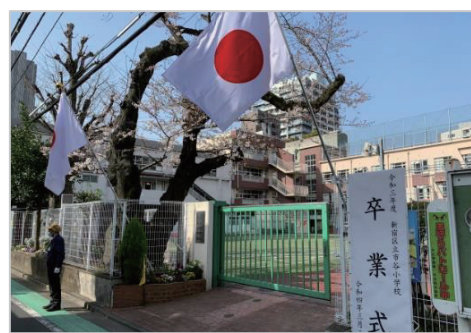
卒業式（区立小学校）