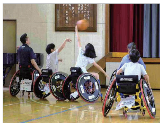
障害者スポーツ体験