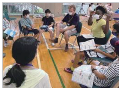
英語キャンプ再開