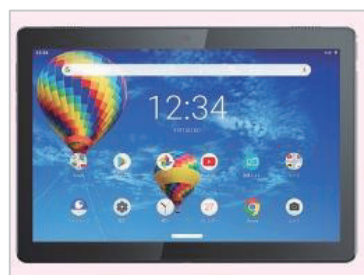
LTE通信対応タブレット