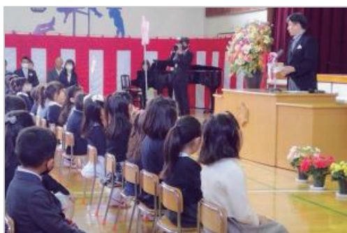
入学式の様子（区立小学校）