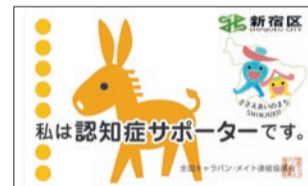
認知症サポーターカード