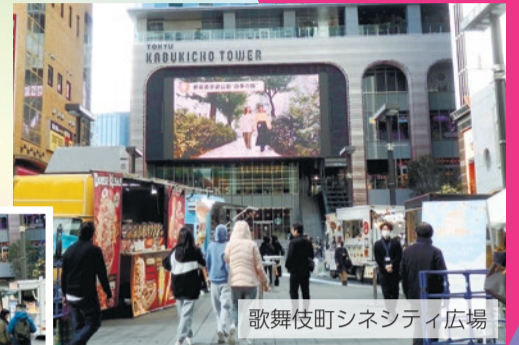
歌舞伎町シネシティ広場