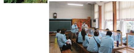
体験のために農業体験の場の手入れや実地踏査を行っています。

令和6年度も農業体験や子ども自然体験キャンプ、親子自然体験を実施予定です。実施が決まりましたら、広報新宿や新宿区ホームページ、チラシなどでお知らせします。