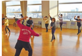
健康寿命の延伸(新宿いきいき体操)