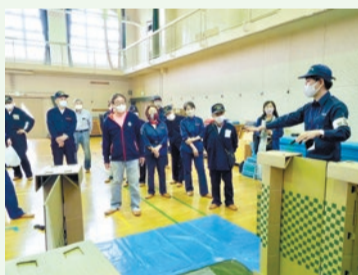
小学校体育館での避難所防災訓練の様子

そのため、6年度は地域住民や消防等と連携した総合防災訓練の実施や、福祉避難所の運営体制の強化、マンション自主防災組織の結成を促進する取り組みを実施します。また、罹災証明書発行事務等をデジタル化するほか、耐震性が特に十分でないブロック塀等を対象に、アドバイザーの派遣制度を新設するほか、助成制度の拡充を行います。