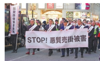
暮らしやすい安全で安心なまちの実現(悪質売掛被害防止キャンペーン)