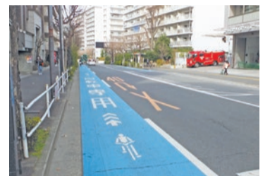
交通環境の整備(自転車通行空間(自転車専用通行帯)の整備)