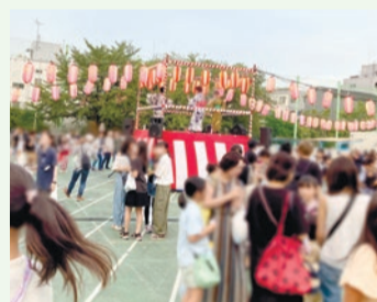
地域のイベントの様子

町会・自治会の活動を後押しし、地域コミュニティを活性化させ、暮らしやすいまちを実現するため、「(仮称)新宿区町会・自治会活性化推進条例」を制定するとともに、条例の推進に必要な施策を計画的に実行するため、「(仮称)新宿区町会・自治会活性化等推進プラン」の策定に向けた検討を行ってまいります。