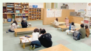
児童クラブの様子

児童クラブについては、定員拡充を図るとともに、夏休みなどの長期休業期間中のお弁当を専用サイトから申し込みいただき、配送するサービスを開始します。