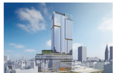
まちづくり(新宿駅西口地区開発計画)