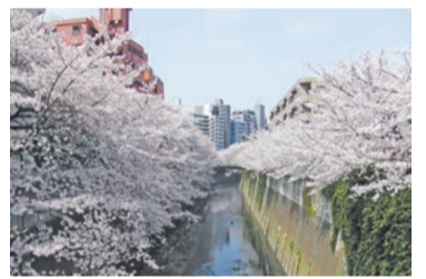
豊かなみどりの創造と魅力ある公園等の整備(神田川沿いの桜並木)