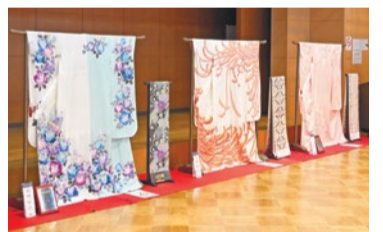
活力ある産業が芽吹くまちの実現(区地場産業の染色によるはたちのつどいの晴着)