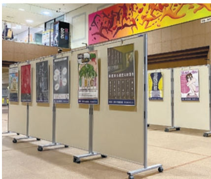
昨年度の展示の様子