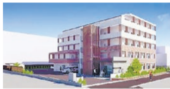
障害者がいきいきと暮らし続けられる環境の整備(払方町国有地の障害者グループホーム等の完成予想図)