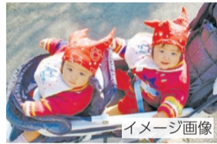
安心できる子育て環境の整備(多胎児支援)