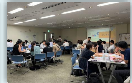
令和5年度はワークショップ形式での協議会を全5回実施