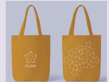
令和5年度エコバッグ