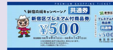
令和5年度 紙商品券見本