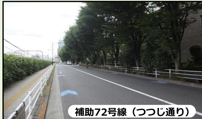
補助72号線（つつじ通り）