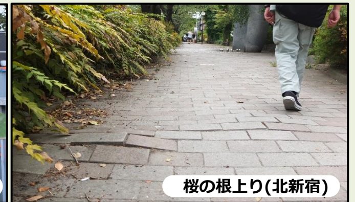
桜の根上り(北新宿)