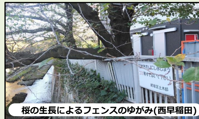
桜の生長によるフェンスのゆがみ(西早稲田)