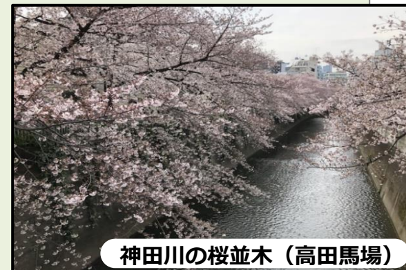
神田川の桜並木（高田馬場）