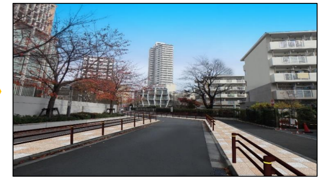
整備後のイメージ