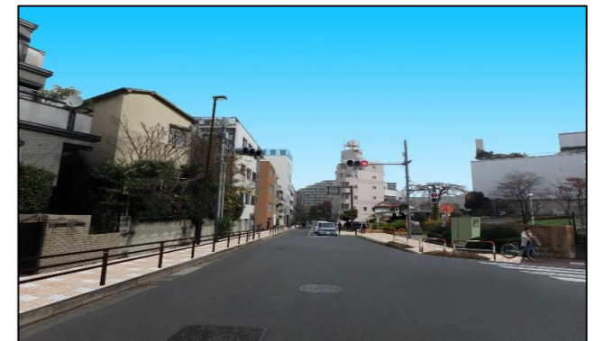
整備後のイメージ