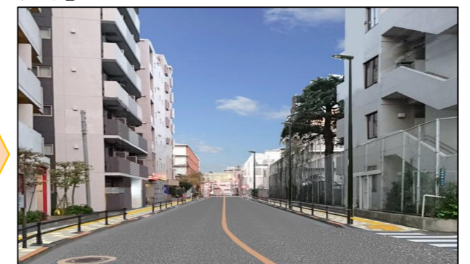
整備後のイメージ