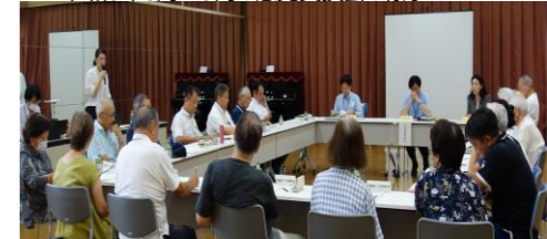
令和5年8月～9月の意見交換会の様子