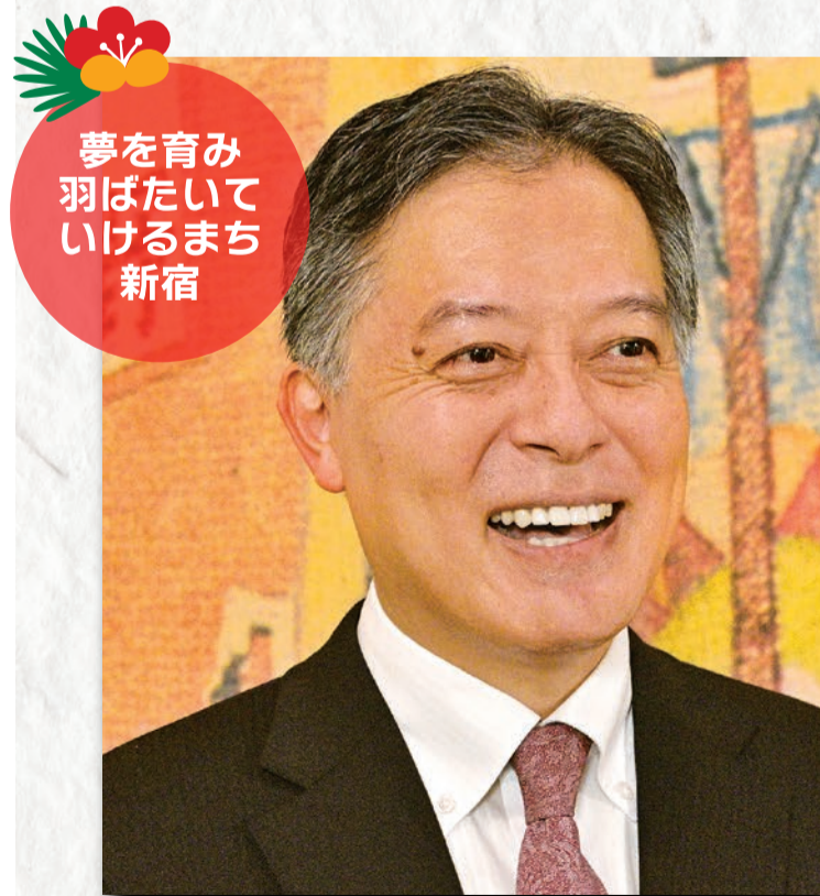
夢を育み 羽ばたいて いけるまち 新宿