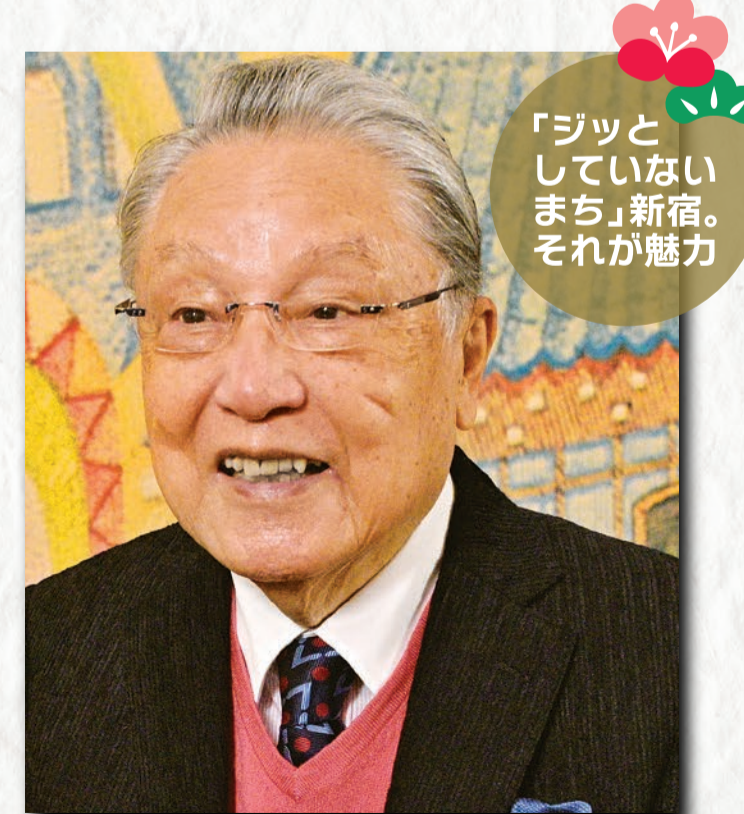
「ジッと していない まち」新宿。 それが魅力