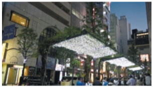
新宿歌舞伎町区役所通りイルミネーション

11月 月上旬 国史跡「林氏墓地」の公開 同新宿歴史博物館。1日~7月2月28日 新宿歌舞伎町区役所通りイルミネーション 同NPO法人新宿歌舞伎町区役所通り3Aの会。1日~15日 菊花壇展=新宿御苑日本庭園 同新宿御苑。西の日(5日・17日・29日) 大酉祭=皆中稲荷神社、熊野神社、須賀神社、成子天神社、花園神社ほか。10日 ここ・からまつり=新宿ここ・から広場 同子ども家庭支援課管理調整係。中旬 若者のつどい 同男女共同参画課。落合第二地域センターまつり 同センター。新宿かしわまつり=柏木地域センター 同センター。しんじゅく逸品マルシェ=新宿駅西口広場 イベントコーナー 同産業振興課産業振興係。23日 新嘗祭=穴八幡宮、稲荷鬼王神社