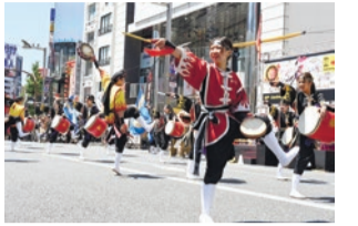
新宿エイサーまつり

7月 7月~8月 新宿中央公園水と緑のイブニングバー=新宿中央公園 同園管理事務所。7月~9月 新宿中央公園ジャブジャブ池の開設=新宿中央公園 同園管理事務所。月上旬 山開き=月見岡八幡神社。「社会を明るくする運動」パレード・式典=新宿通り 同子ども家庭課企画係。15日・16日 エンマ大王開帳=太宗寺。中旬~8月中旬 神田川親水テラスの開放 同みどり公園課みどりの係。24日~27日 神楽坂まつり(ほおずき市・阿波踊り大会) 同神楽坂通り商店会事務所。27日 新宿エイサーまつり=新宿通りほか 同新宿駅前商店街振興組合