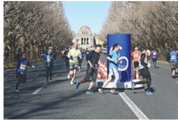
新宿シティハーフマラソン・区民健康マラソン

1月 1日 歳旦祭=葛谷御霊神社。1日から新宿山の手七福神詣で○弁財天=巖嶋神社○恵比寿=稲荷鬼王神社○福祿寿=永福寺○大黒天=経王寺○毘沙門天=善國寺○布袋尊=太宗寺○寿老人=法善寺。干支祈願=稲荷鬼王神社。七福神まつり=成子天神社。5日 初弁天祭=巖嶋神社。8日 湯花神事=花園神社。はたちのつどい=京王プラザホテル 総務課総務係。13日 おびしゃ祭=葛谷御霊神社、中井御霊神社。15日・16日 エンマ大王開帳=太宗寺。28日 円空仏公開(毎月28日午後)=中井出世不動堂 文化観光課文化資源係。新宿シティハーフマラソン・区民健康マラソン=国立競技場ほか 新宿未来創造財団。牛込笹笥地域まつり=牛込笹笥地域センター 同センター