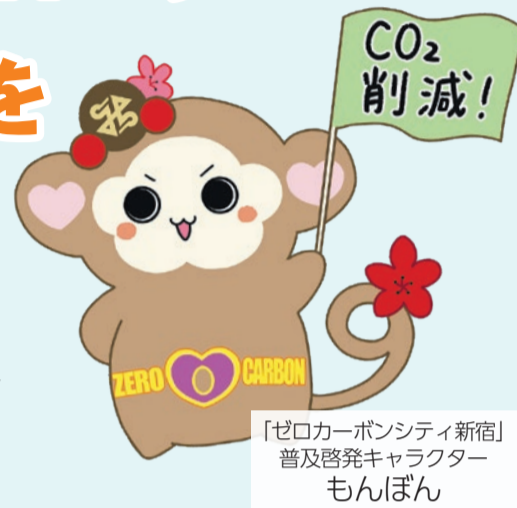
「ゼロカーボンシティ新宿」 普及啓発キャラクター もんぼん

ゼロカーボンシティとは、脱炭素社会に向けて、2050年のCO 2 排出量実質ゼロに取り組むことを表明した地方公共団体のことです。区は、「ゼロカーボンシティ新宿」の実現に向けて、CO 2 排出削減に取り組んでいます。今回は、1面で「ゼロカーボンシティ新宿」の実現に向けた区の取り組みや、ごみの分別方法の変更を紹介し、2面では、省エネへの取り組みに関する支援など、環境対策・ごみの削減等に関する情報を紹介します。