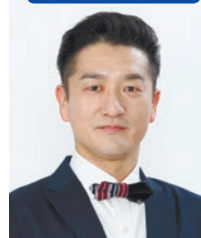
キクチウツカナノイ。 八木真澄(サバンナ)