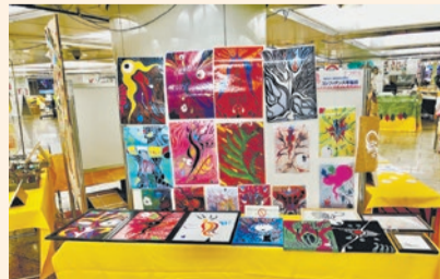
昨年の手づくりマーケットin新宿の様子