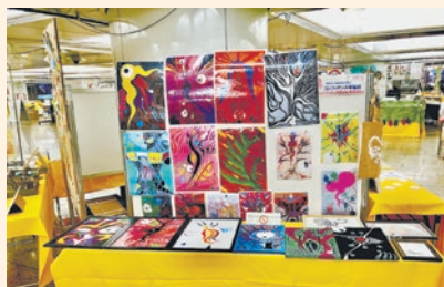
昨年の手づくりマーケットin新宿の様子