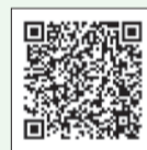
過去の掲載 記事はこちら