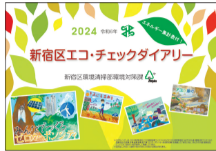
新宿エコ・チェックダイアリー

環境絵画・環境日記展2023の受賞作品や環境学習情報センターの事業を掲載しています。毎月のエネルギー使用量を記録でき、環境家計簿としても活用できます。