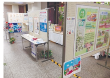
人権啓発パネル展