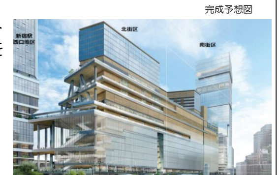
完成予想図