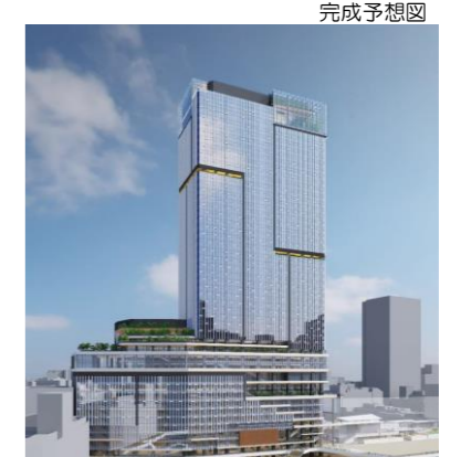
完成予想図