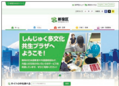
パソコン版トップページ

●より使いやすく分かりやすいホームページを目指しデザインを刷新しました 同ホームページ(右二次元コード)では、区に関わる行政情報(手続きや制度等)や外国語相談窓口、日本語教室、イベントなどの情報を日本語・英語・中国語・韓国語で毎月3回(5・15・25日)発信しています。 ●検索機能を強化しました キーワード検索のほか、目的・対象者ごとの検索機能を追加し、さまざまな方法で情報を探せるようになりました。 問合せ 多文化共生推進課 多文化共生推進係(本庁舎1階) ☎(5273)3504