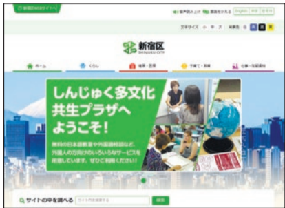
パソコン版トップページ

●より使いやすく分かりやすいホームページを目指しデザインを刷新しました 同ホームページ(右二次元コード)では、区に関わる行政情報(手続きや制度等)や外国語相談窓口、日本語教室、イベントなどの情報を日本語・英語・中国語・韓国語で毎月3回(5・15・25日)発信しています。 ●検索機能を強化しました キーワード検索のほか、目的・対象者ごとの検索機能を追加し、さまざまな方法で情報を探せるようになりました。 問合せ 多文化共生推進課 多文化共生推進係(本庁舎1階) ☎(5273)3504