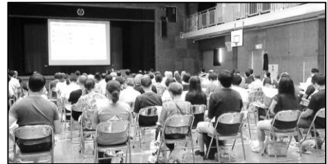
牛込仲之小学校での手続き説明会の様子 (令和5年9月8日・9日開催)