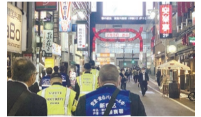
歌舞伎町の安全・安心パトロール