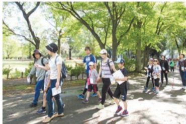
健康づくりの取り組み(しんじゅくシティウォーク)