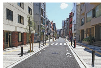
無電柱化した道路