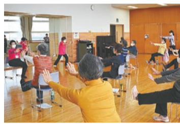
高齢期の健康づくりの取り組み(新宿いきいき体操)