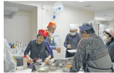
多世代交流の普及啓発

第三次実行計画は、令和6年度~9年度の区の施策を具体化した行財政計画です。第三次実行計画は現在の総合計画に掲げる目標を達成し、令和10年度から始まる新たな総合計画の礎を築く計画として策定します。