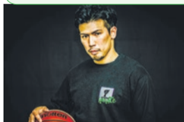
永田裕幸(リオデジャネイロパラリンピック日本代表)