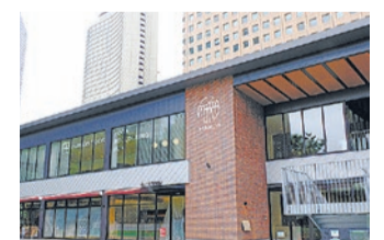
Park-PFI活用事例(新宿中央公園[SHUKNOVA])