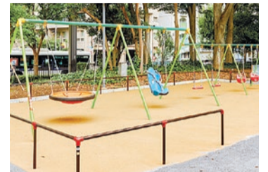
新宿中央公園(インクルーシブ遊具)