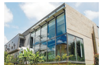
新宿の歴史・文化の魅力向上(漱石山房記念館)