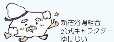
新宿浴場組合 公式キャラクター ゆげじい