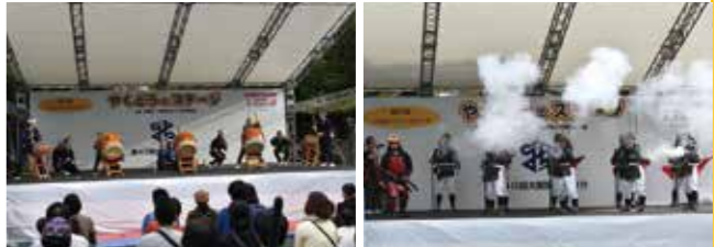
※時間に変更の生じる場合があります。予めご了承ください。

【各広場に出展している団体の主な出展内容】 物販 物品販売 食品 食品販売 参加 参加体験 調理 現地調理 展示 展示・PR 他 その他