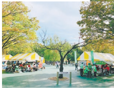
戸山公園やくどうの広場