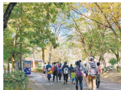
ウォーキングの様子