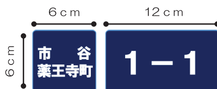
町名表示板・住居番号表示板の例

玄関や門など、人目につきやすい場所にコンクリートボンドやビス、針金で貼り付けます。