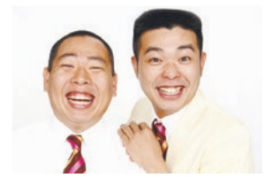
ゲスト:レギュラー