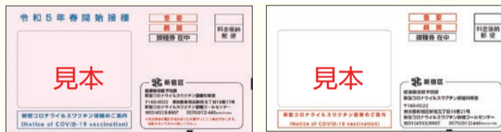
令和5年春開始接種の封筒