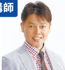
田中光 (アトラントオリンピック 日本代表)