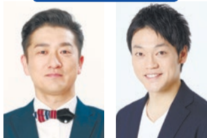
司会:キクチ ゲスト:おばた ウソツカナイ。のお兄さん